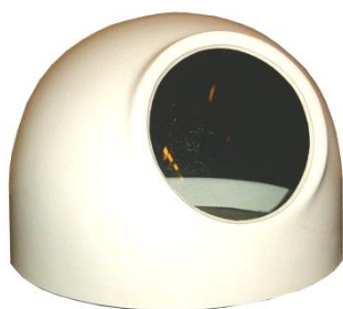
Art. 032 Cuffia con oblò per chiesuola mod. FF2.