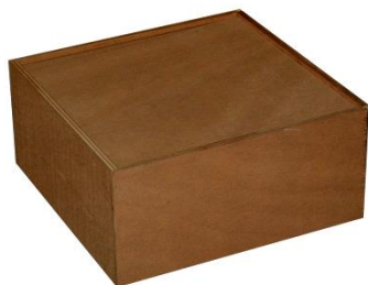
Art. 031 Cassetta in legno per bussola di rispetto