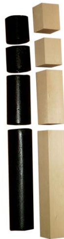
Art. 035 Elementi ferro dolce e legno per sbarre di flinder