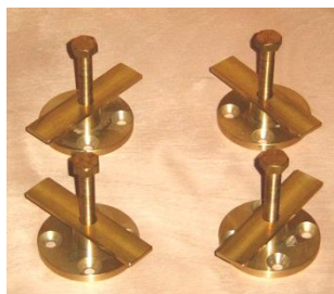
Art. 033 4 Chiapponetti in bronzo per fissaggio chiesuola mod. FF2.