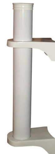
Art. 036 Supporti con tubo per sbarra di flinder.